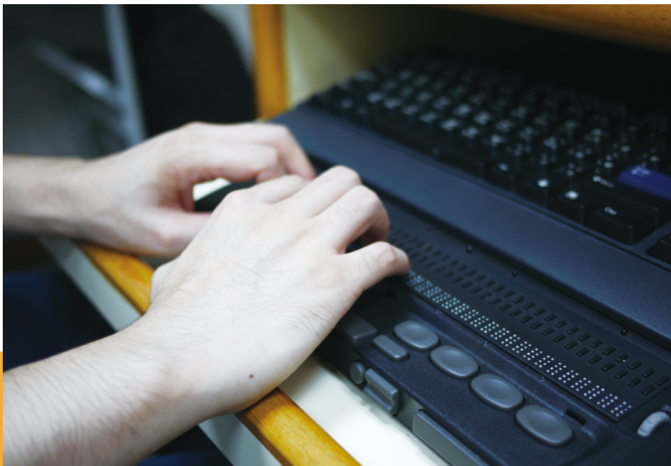
[圖片] 描述：一雙手正在觸摸點字顯示器